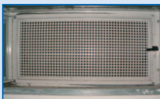
Stahllochblende (Kellerfenster innen) mit Vorhangschloss

Abschließbare bewegliche Vergitterung bzw. feststehende Vergitterung im Mauerwerk verankert.