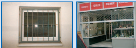
Vergitterung oder einbruchhemmende Verglasung

Abschließbare bewegliche Vergitterung bzw. feststehende Vergitterung im Mauerwerk verankert.